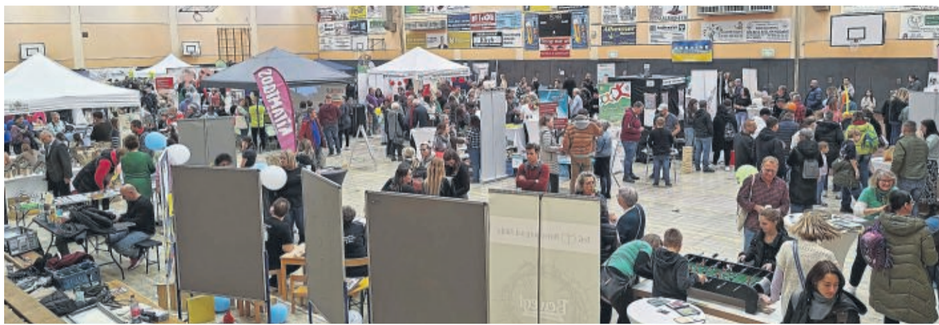
Die Familienmesse fand in der Großsporthalle in Rotenburg statt.

Die Heinrich-Auel-Schule stellte ihre Projekte vor und lud zu ihrem Weihnachtsmarkt am 28. November ein. Einen Vorgeschmack auf die Geschenkideen, die dort angeboten werden, konnte man an ihrem Stand bereits bekommen. An anderen Ständen stand das Thema „Trinken“